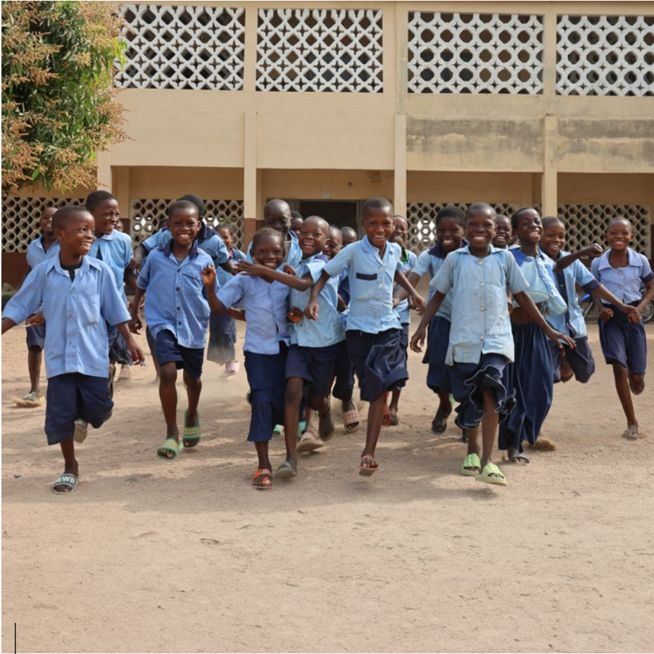
De kinderen spelen met elkaar op het schoolplein.