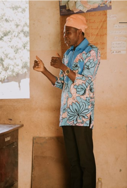
— Een goede leerkracht heeft interactie met de klas.