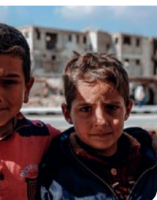
Ingestorte gebouwen in Syrië