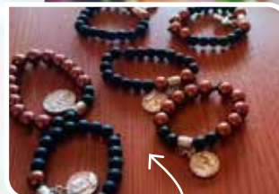
Dit zijn armbandjes die Jorai maakt.