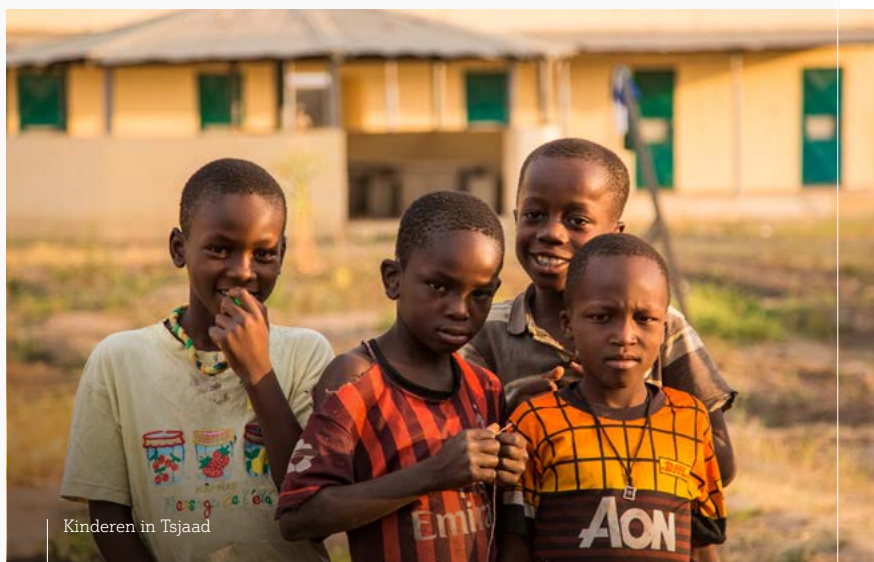
Kinderen in Tsjaad