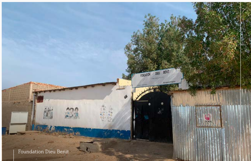
Fondation Dieu Benit