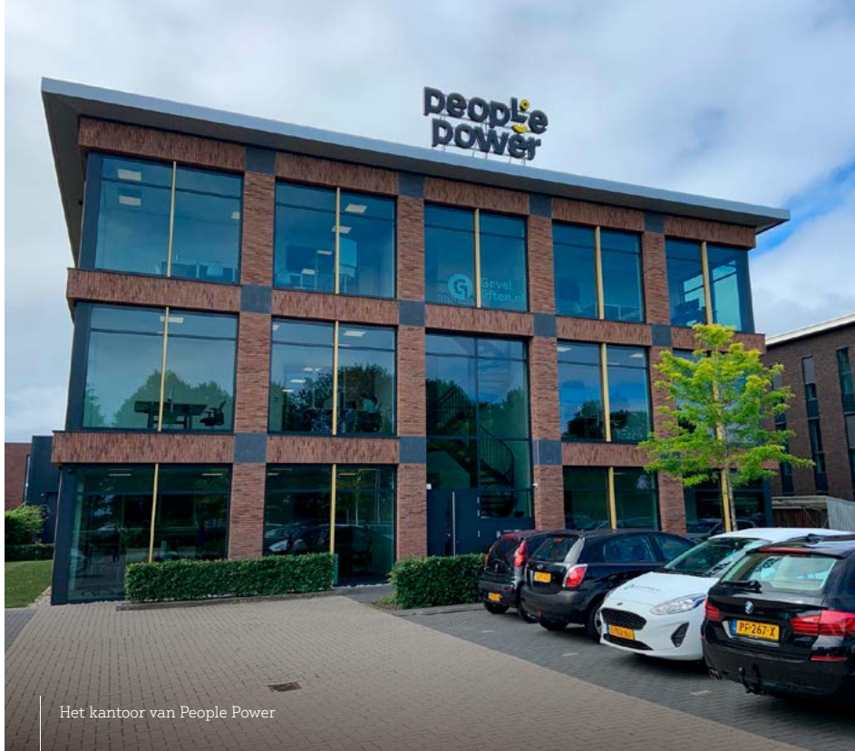
Het kantoor van People Power

Hij wil niet alleen oog hebben voor de mensen die hun successen vieren, maar juist ook voor hen die het moeilijker hebben. 'Het is belangrijk dat we ons realiseren dat ook hier in Nederland veel jongeren een moeilijke start maken. Meer dan eens leidt dat tot het niet succesvol afronden van studies. Des te belangrijker dat je daarna een kans krijgt om je vanuit een werkomgeving te ontwikkelen. Daar gaan wij voor. Als je laat zien dat je er echt voor wilt gaan, dan bieden wij een intern opleidingstraject aan.'