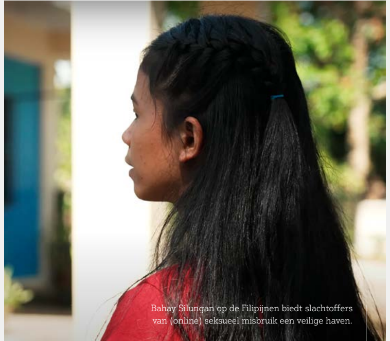
Bahay Silungan op de Filipijnen biedt slachtoffers van (online) seksueel misbruik een veilige haven.

In de opvanghuizen verwerken de kinderen hun trauma's, worden ze verzorgd en krijgen ze onderwijs. Ook komen ze in aanraking met het Evangelie. In sommige landen wordt de Bijbel gelezen in het opvanghuis. In andere landen staat de overheid niet toe dat het Evangelie gedeeld