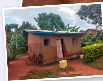
Musa en zijn vrouw bij het nieuwe huis dat ze bouwen