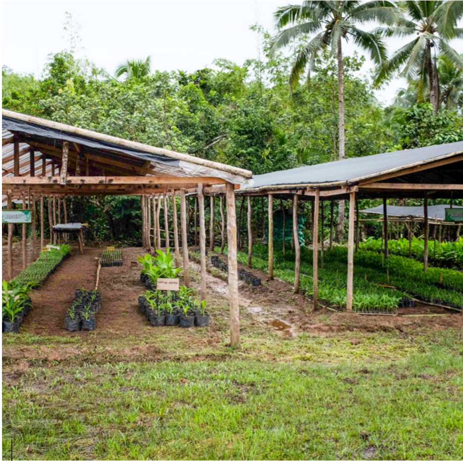
Het terrein van coöperatie INOSA.