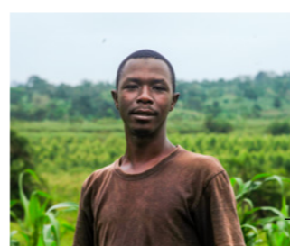
De boeren oogsten hun gewas.