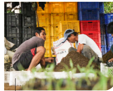
De boeren werken samen bij het stekken van de abacaplanten.