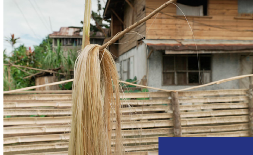
Abacavezels hangen te drogen bij coöperatie INOSA.